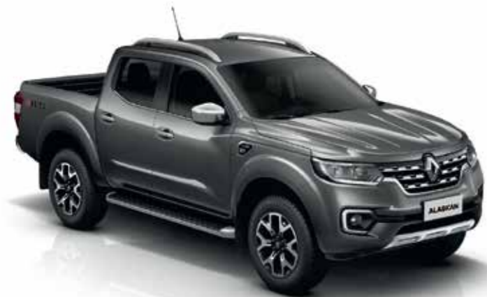
Gris Metálico (TE)

OV: barniz opaco. TE: pintura metalizada. Fotos de referencia.