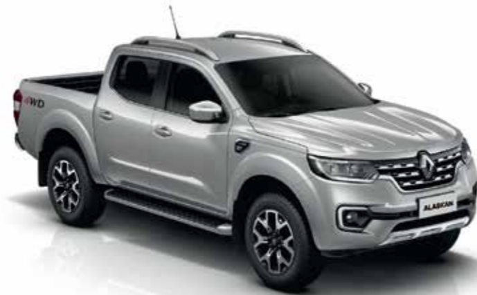
Gris Luna (TE)