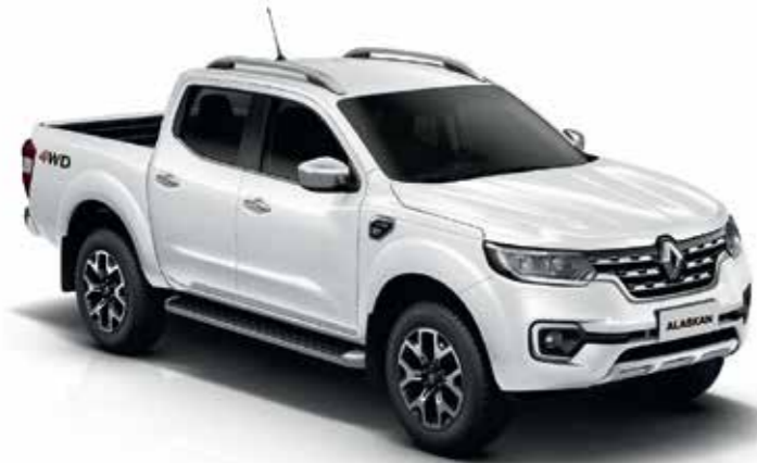
Blanco Hielo (OV)