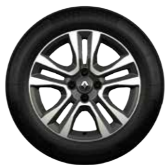
Rin de aluminio Jogger 16" diamantado