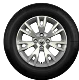
Embellecedor Eptius 15"