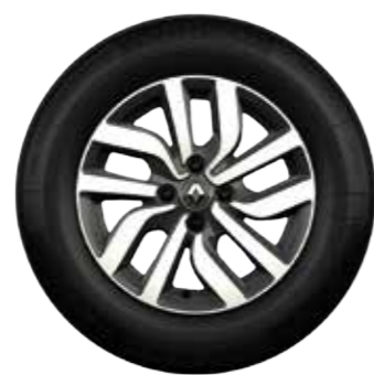
Rin de aluminio Premia 15" diamantado